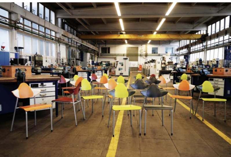
20 Auszubildende könnten in diesem Jahr bei Gestamp starten. Doch die Plätze bleiben frei.

AUSBILDUNGSSTART Bei Gestamp und Dürkopp Adler bleiben Werkbänke leer. 2025 kommen keine neuen Auszubildenden. Ein Trend, der nicht nur dort umgekehrt werden muss.